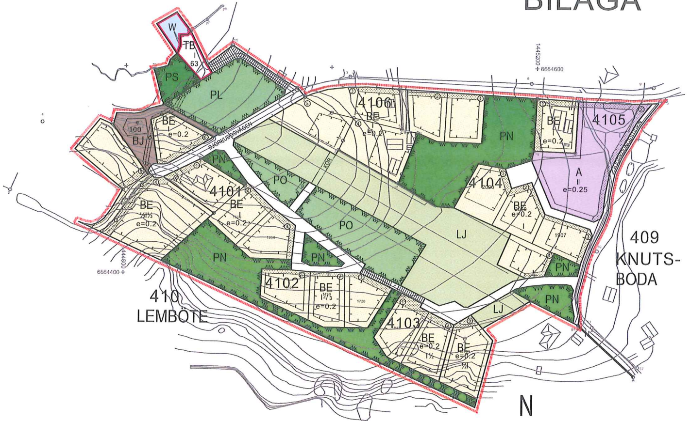
Fastställd plan 2010